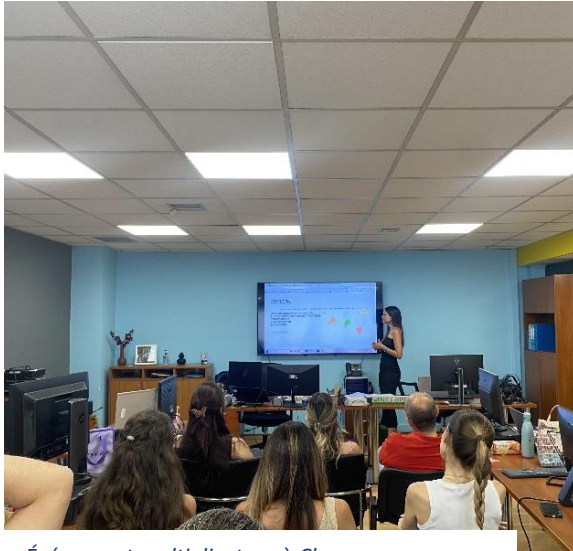
Événement multiplicateur à Chypre, HEARTHANDS SOLUTIONS, 25 juin.

été présenté, expliquant son contenu et ses objectifs. Les grandes lignes ont été discutées, de la constitution du partenariat à l'illustration détaillée des résultats du projet : un accent particulier a été mis sur la plateforme en ligne qui contient tous les résultats du projet et sur le processus du programme d'incubation. Après la présentation du matériel promotionnel et du site web du projet, un dialogue dynamique et interactif a eu lieu, les participants s'engageant activement et partageant leurs impressions par le biais d'un questionnaire. L'événement s'est conclu par une session de mise en réseau au cours de laquelle les participants ont échangé leurs