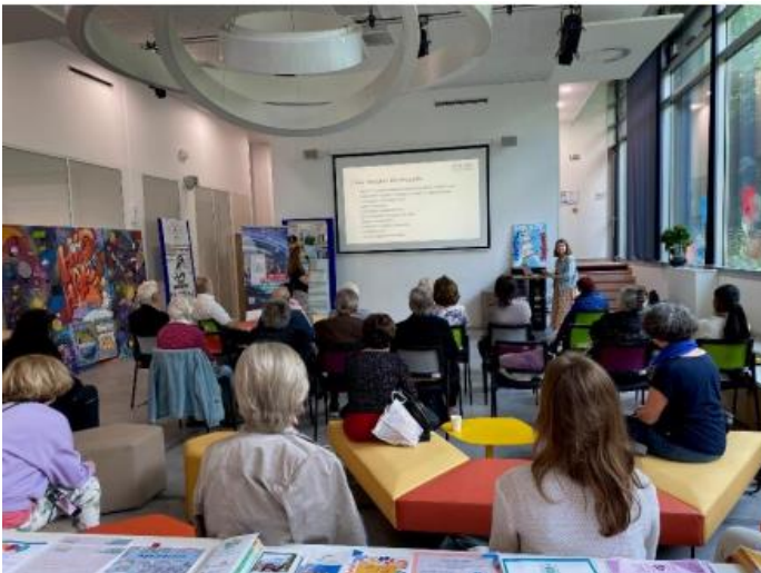
Événement multiplicateur en France, E-seniors, 20 juin.

Alors que le projet SENIOR+ touche à sa fin, nous sommes ravis de partager les expériences du consortium avec le récent événement multiplicateur.