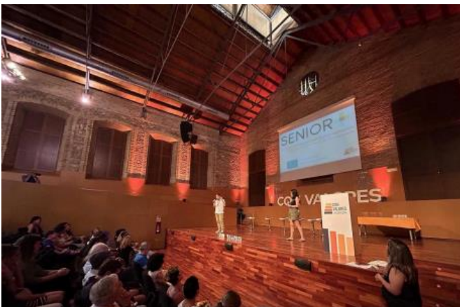
Événement multiplicateur en Espagne, Asociación Con Valores, 27 juin.

Le partenaire espagnol "Asociación Con Valores" a organisé son événement multiplicateur le 27 juin de 18h00 à 21h00. L'événement SENIOR+ a rassemblé des participants d'horizons divers, y compris des entrepreneurs en herbe issus de l'immigration et confrontés à des défis importants en matière de développement d'entreprise à un âge avancé. En termes d'expérience professionnelle, les participants allaient de ceux qui commençaient tout juste à entreprendre à ceux qui avaient plusieurs années d'expérience. Con Valores' a réussi à attirer un grand nombre de personnes, jusqu'à 103 participants !