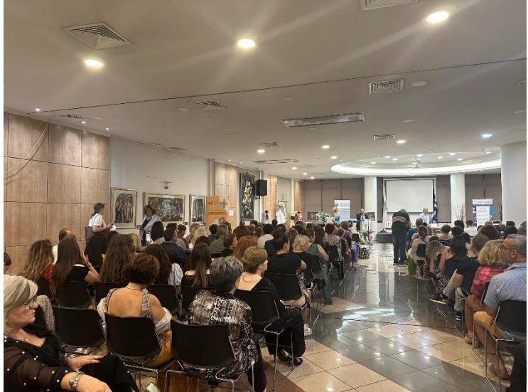
Événement multiplicateur en Grèce, IDEC, 28 juin.

Le partenaire grec IDEC a récemment organisé son événement multiplicateur le 28 juin, attirant avec succès 50 participants qui se sont réunis pour explorer le rôle vital de l'esprit d'entreprise chez les personnes âgées de 55 ans et plus, en soulignant les compétences essentielles requises pour leur développement. Au cours de la réunion, une attention particulière a été accordée à la présentation des contributions et des résultats uniques obtenus grâce au projet SENIOR+, soulignant sa valeur ajoutée dans la stimulation et l'encouragement de l'esprit d'entreprise chez les seniors. L'événement a servi de plateforme pour mettre en valeur les réussites, partager des idées intéressantes et discuter de stratégies pour améliorer le soutien et les opportunités au sein de ce groupe démographique.